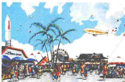
●ワールドグルメ・バザールゾーン

いながらにアコガレの国々へ旅した気分が味わえるワールドグルメ・バザールゾーン。アメリカのウェストコーストをイメージさせるこの空間には、民族衣装も華やかに世界の国々のショップ、レストランがずらり。国際的な雰囲気の中、ショッピングや食事を楽しむことができます。