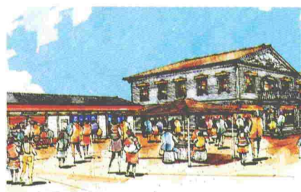
●郷土グルメ・バザールゾーン