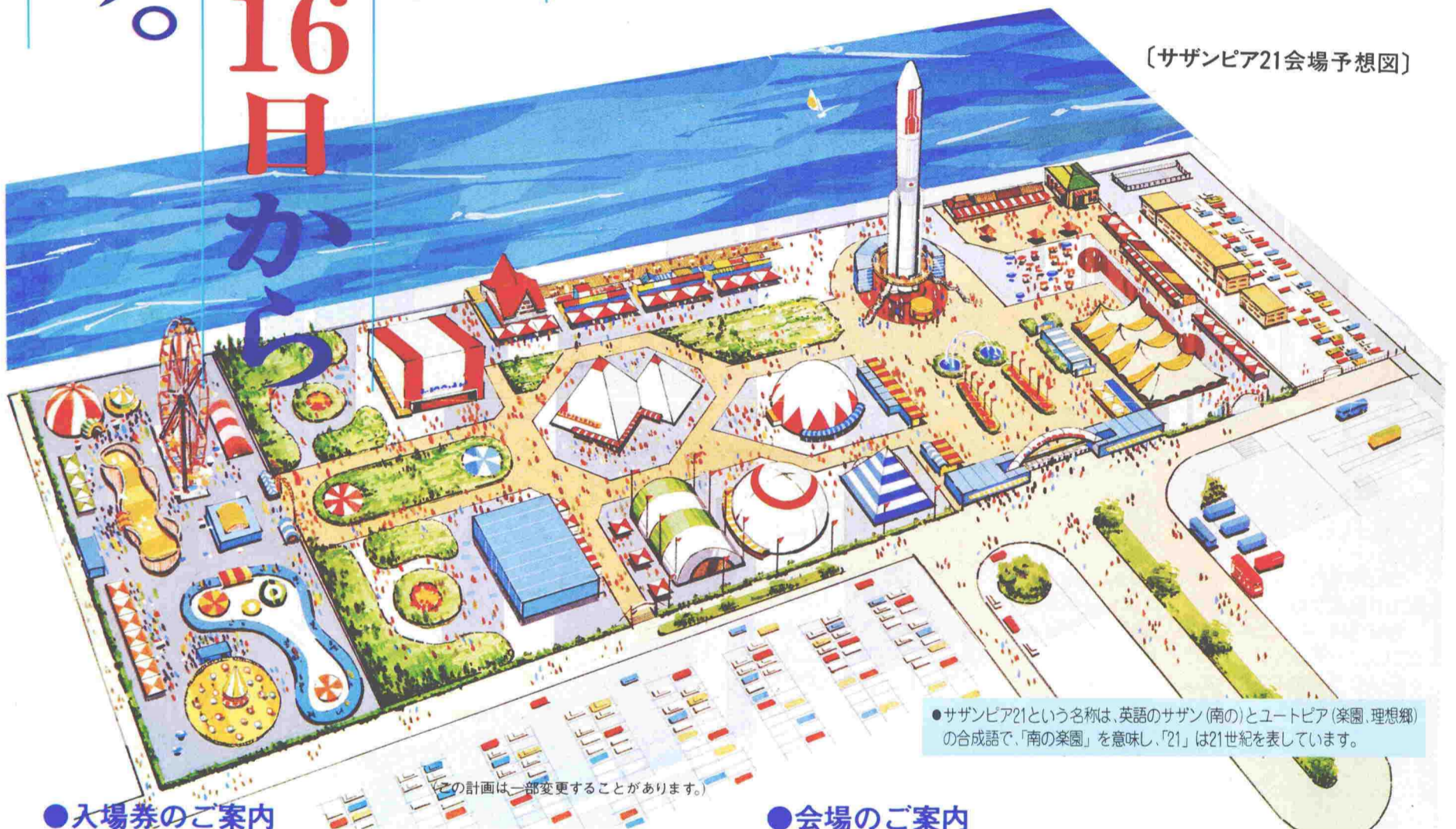
〔サザンピア21会場予想図〕

さらに第1期前売入場券をお買い求めの方は第2期の抽選も受けられるダブルチャンスがあります。