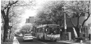
赤字解消に向けて、年間あと2往復のご乗車をお願いします