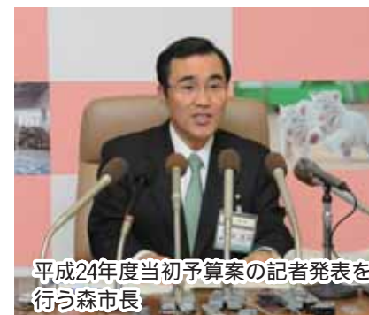
平成24年度当初予算案の記者発表を 行なう市長

今年度の当初予算は、一般会計で2234億6200万円、特別会計・企業会計を合わせた鹿児島市全体の総額は3977億9700万円となり、前年度に次いで過去2番目の予算規模となりました。 歳入面では税制改正などにより、一定の市税収入を確保するとともに、歳出面では財政の健全性を維持しながら、徹底した事務事業のしゅん別・見直しを行うなど創意工夫を重ね、第五次総合計画の初年度として“豊かさ” 実感都市・かごしまの実現に向け、力強くスタートダッシュする予算を編成しました。【財政課 216-1155】