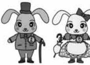
メルくんとルンちゃん

〒892-0853城山町5-1かごしまメルヘン館「5月メルヘンワークショップ」係226-7771へ