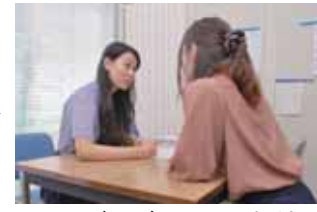
アドバイザーによる相談