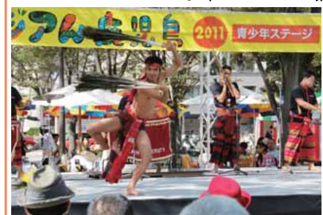
海外の団体や市内の青少年によるステージ

※詳しくは公式ホームページ http://www.seaon.jp/asian/ をご覧ください