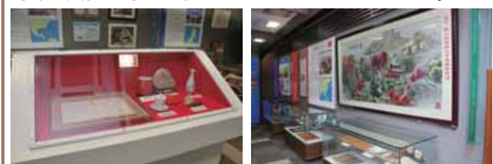
各都市ごとの紹介・展示コーナー

また、近年は、地理的に近く、歴史的に深いアジア各国の都市との交流も盛んになり、韓国やマレーシアから贈られた品も展示しています。情報提供コーナーもあり、海外の文化を身近に感じることのできるサロンです。