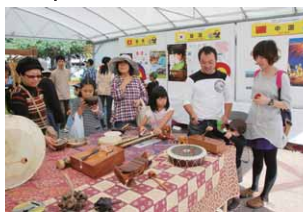
アジア各国の楽器を体験