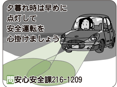
夕暮れ時は早めに点灯して安全運転を心掛けましょう 問 安心安全課216-1209

犯罪被害者支援フォーラム2012 in かごしま 期 11月30日(金)13時30分~16時 ※13時開場 所 かごしま県民交流センター 問 かごしま犯罪被害者支援センター805-7830