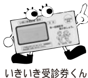
いきいき受診券くん