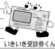
いきいき受診券くん

◇受付時間 胃・腹部：8時30分~9時30分、子宮・乳：8時30分~9時か13時~13時30分