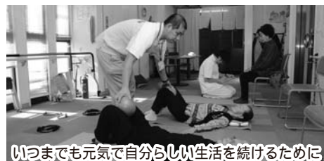
いつまでも元気で自分らしい生活を続けるために

■はつらつ元気づくり教室など介護予防プログラム(無料)を利用するには ①元気づくり高齢者調査票(介護認定を受けていない65歳以上の人に送付)を送付 ↓ ②調査の結果、介護予防プログラムに参加することが望ましいと判断された人には、地域包括支援センターの職員が訪問し、本人や家族と介護予防ケアプランを立てる ↓ ③はつらつ元気づくり教室など介護予防プログラムに参加する