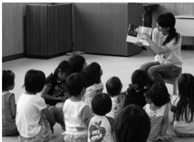
私たちと一緒に活動しませんか

◆申し込み はがきかファクス、Eメールで、郵便番号、住所、氏名、年齢、性別、電話番号、「ボランティア登録希望」を書いて、〒890-0062 与次郎一丁目10-17 すこやか子育て交流館812・7740 (FAX 812・7744、Eメール koso-kouryu@city.kagoshima.jp)へ