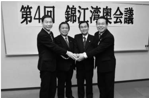
第4回錦江湾奥会議で4市長ががっちり握手 (左から尾脇垂水市長、前田霧島市長、森鹿児島市長、笹山始良市長)