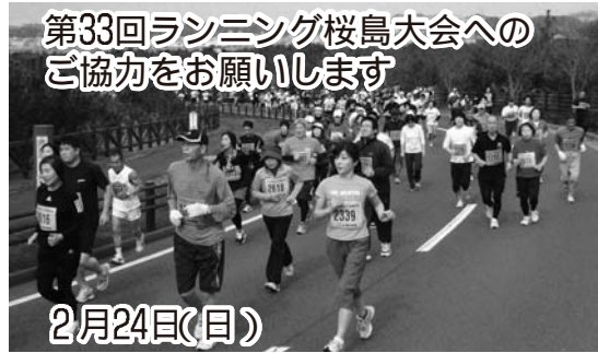
第33回ランニング桜島大会へのご協力をお願いします

開催に伴う通行止め ランナーの安全確保のため、通行止めにご理解とご協力をお願いします。 ◇規制期日 2月24日(日) ◇規制時間・区域 10時～11時 11時・県道桜島港黒神線の一部(桜島袴腰交差点付近)～桜島二俣港退避舎付近(9時45分～11時30分・市道224号線) 【ランニング桜島大会実行委員会事務局(桜島総合体育館内)293・2967】