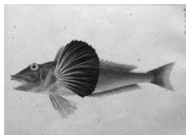
「 げいかいぎよふ 魔海魚譜」より