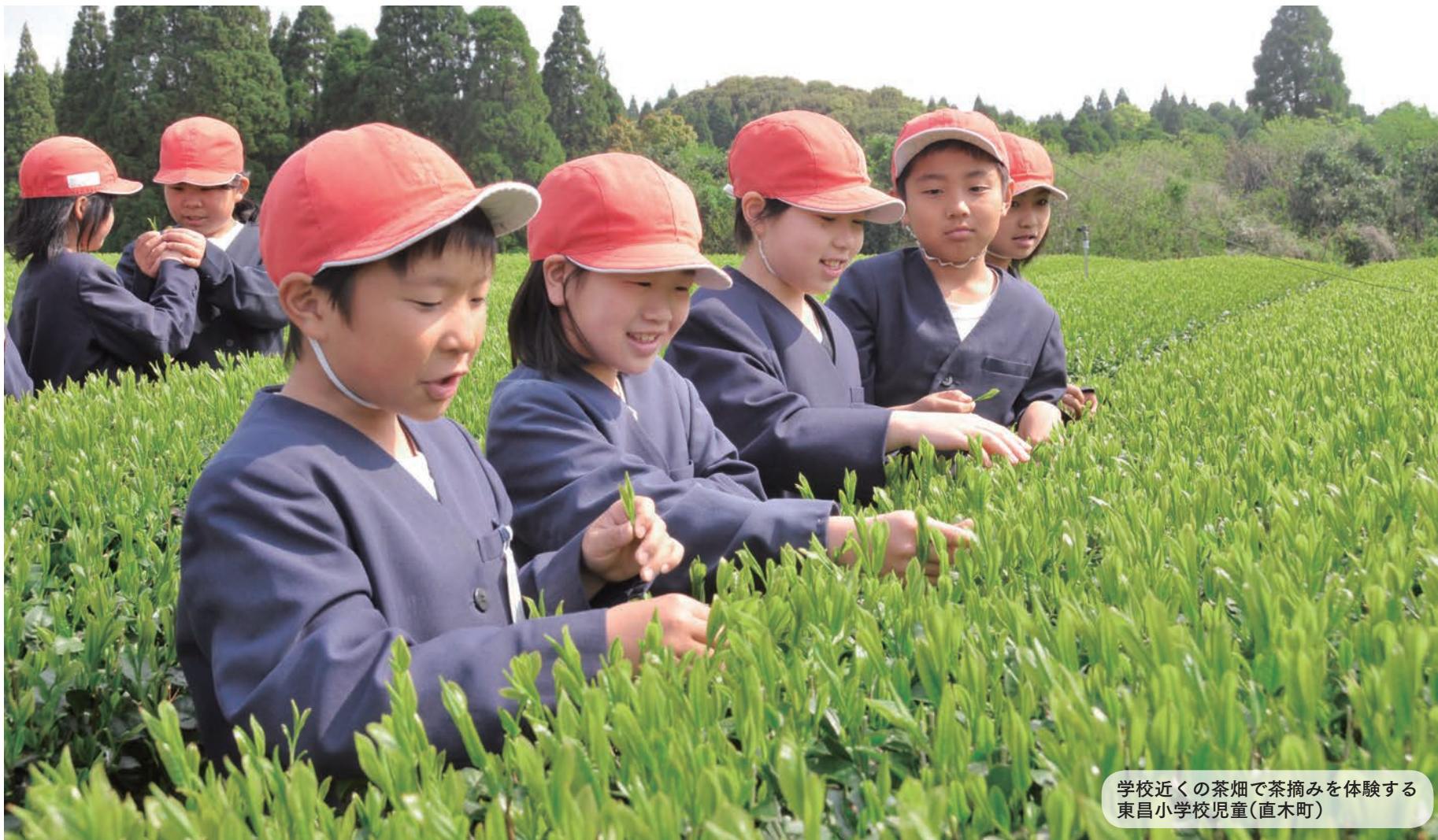
学校近くの茶畑で茶摘みを体験する東昌小学校児童(直木町)

人口(平成25年4月1日現在・推計) ※( )は前月比 人口総数 605,883人 (△1,599) 世帯数 269,029世帯(+ 43)