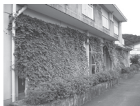
夏の日差しを遮る「緑のカーテン」の活用を