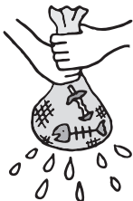
生ごみの水切りもごみ減量に有効です