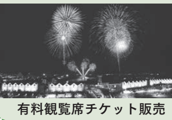
有料観覧席チケット販売