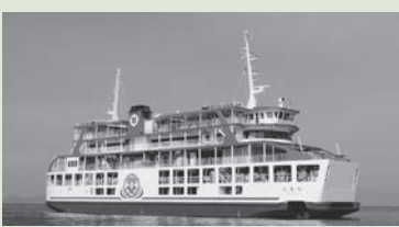
サクラエンジェル