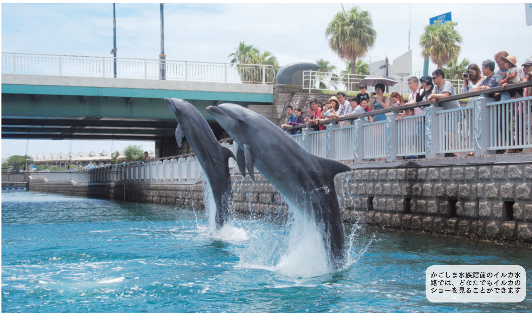
かごしま水族館前のイルカ水路では、どなたでもイルカのショーを見ることができます

人口(平成25年6月1日現在・推計) ※( )は前月比 人口総数 607,531人 (+140) 世帯数 270,814世帯 (+208)