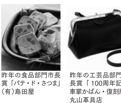
昨年の食品部門市長賞「パテ・ド・さつま」(有)島田屋 昨年の工芸品部門市長賞「100周年記念車掌かばん・復刻版」丸山革具店