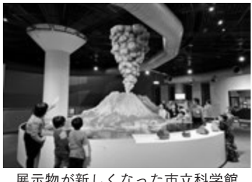
展示物が新しくなった市立科学館

進めました コミュニティビジョンの推進、生物多様性地域戦略の推進、桜島・錦江湾ジオパークの検討、平川動物公園リニューアル事業(世界のサルゾーン、不思議な動物ゾーン、かごしまの動物ゾーン)、南部親子つどいの広場及び新南部保健セン