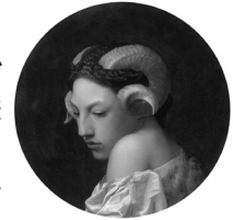
ジャン=レオン・ジェローム 「羊の角をつけた女性の頭部」