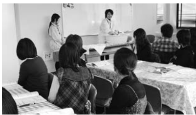
出産準備として受講してみませんか

内 妊娠・出産・育児の学習など 対 初めての妊娠中の人とその家族 期 8月26日～9月9日の毎週月曜日13時30分～16時(全3回) 所 北部保健センター 料 無料 申 電話か所定の申込書で北部保健センター244-5693へ