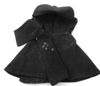
寄贈いただいた防空ずきん(昭和18年)

◇第二次世界大戦中やその前後の資料(被災した生活用品、当時の写真、手紙、書類など)を募集しています 問 総務課216-1125