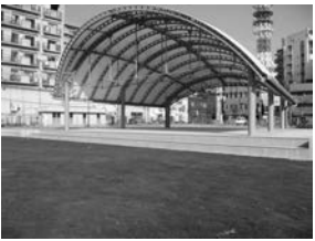
図多目的シェルター