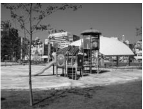
図コンビネーション遊具