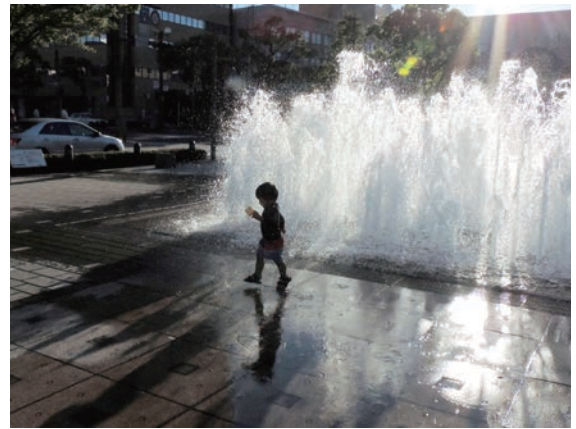
「戯れて」 徳留 やすこ