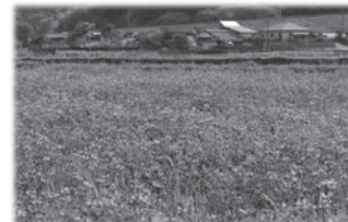
吉田支所近くのレンゲソウ(例年4月上旬頃)