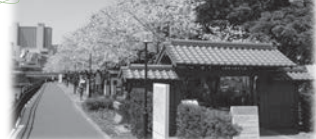
甲突川河畔の桜(例年3月下旬～4月上旬頃)