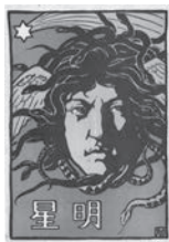
『明星』(明治41年4月号)の表紙絵