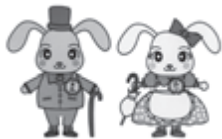
メルくん・ルンちゃん