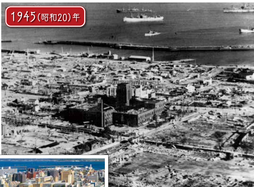
▲空襲で焼け残った市庁舎