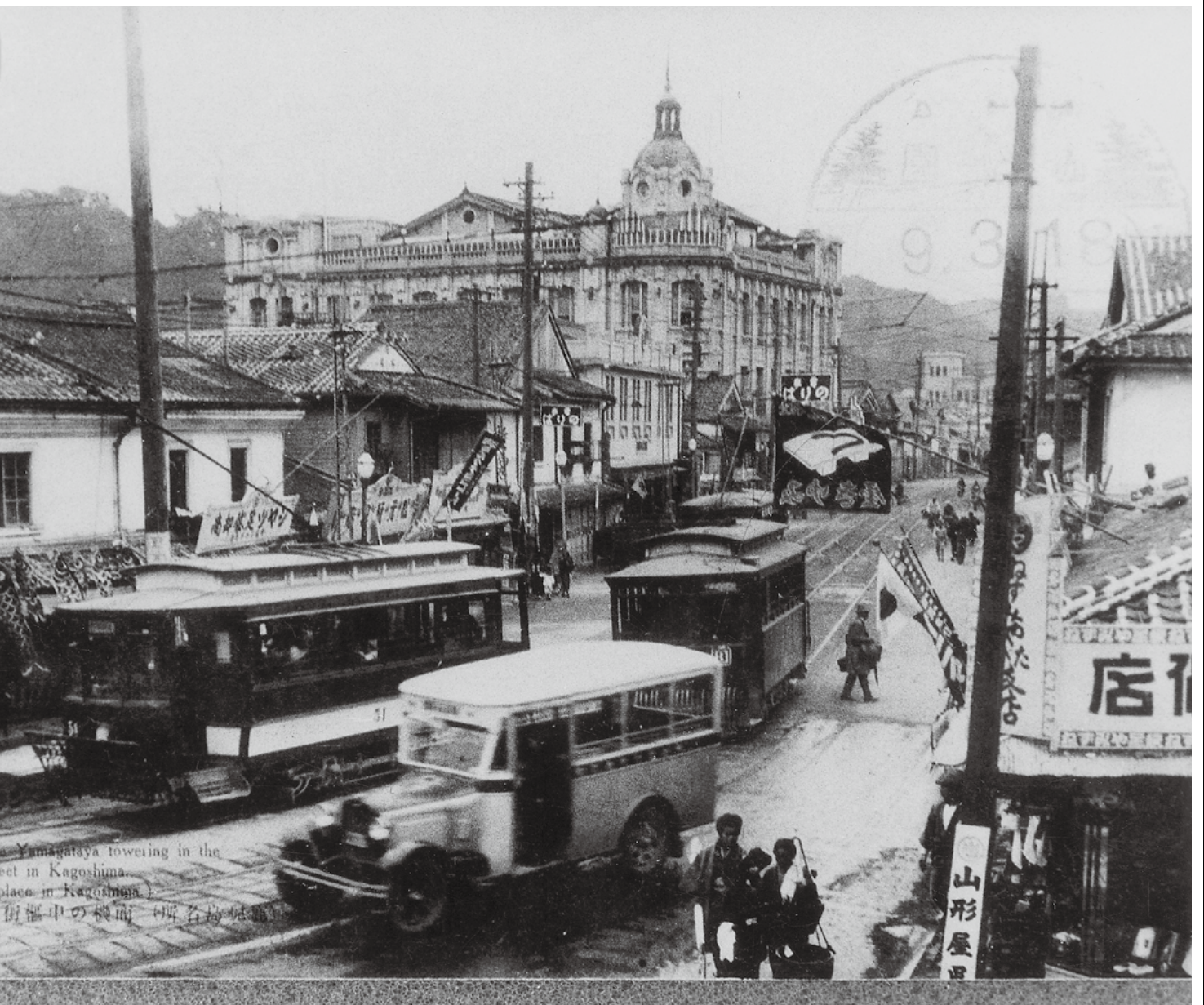
▲いづろ周辺（県立図書館所蔵）