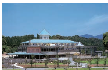
スパランド裸・楽・良