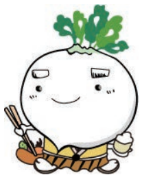
鹿児島市食育推進キャラクター

食を通じて健康で生き生きと生活できる活力あるかごしま市の実現を目指します。5つの基本目標を設け、食育に関する施策を総合的・計画的に推進します。