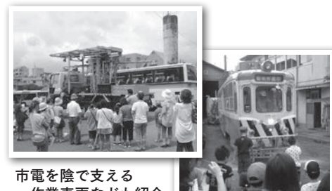
市電を陰で支える 作業車両なども紹介

内普段見ることのできない交通局内の施設や作業車両などの見学など 対市内に住む小学3～6年生とその保護者(2人1組) 期8月27日(水)9時45分～11時45分 所交通局 定30組(超えたら抽選) 料無料 申往復はがきに住所、参加者全員の氏名、学年、電話番号を書いて、8月19日(必着)までに〒890-0051高麗町43-41交通局総務課「施設見学会」係257-2111へ