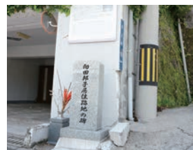
居住跡地に建つ碑(平之町)