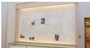
鹿児島島のゆかりの場所なども文章とあわせて紹介しています