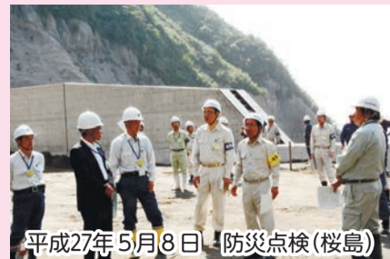
平成27年5月8日 防災点検(桜島)

今月は、風水害への備えをはじめとした防災や防犯・事故防止などを特集しました。家庭や地域で再確認してみませんか。