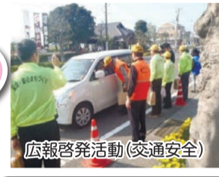
広報啓発活動(交通安全)