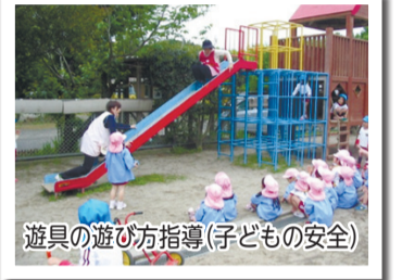
遊具の遊び方指導(子どもの安全)