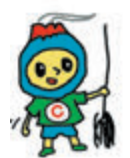
まち美化キャラクター「さくりん」

◇町内会の清掃活動に積極的に参加しましょう 問環境衛生課216-1300(FAX216-1292)