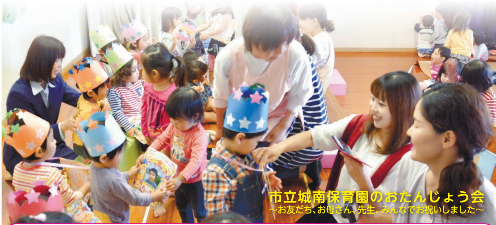
市立城南保育園のおたんじょう会 ～お友だち、お母さん、先生、みんなでお祝いしました～