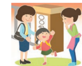
お迎え・延長保育など

遠足、運動会、お誕生会など、年間を通じてさまざまな行事があります。また、低年齢児には、ゆったりと眠りにつけるような静かな環境を整えます。年齢が上がるにつれ、子どもの状況に合わせてお昼寝をしないときもあります。保育士が言葉かけをして、トイレに行く習慣や衣服の着替えなどの基本的な生活習慣を身につけます。給食は、みんなと楽しい雰囲気の中で食事ができるように配慮しています。箸の使い方や食事のしぐさなど基本的なことを学び、食べ物に対する感謝の気持ちも育てます。