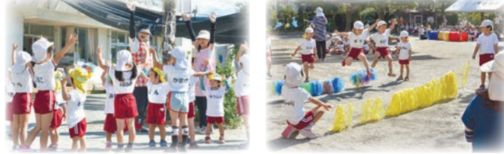
元気に運動会の練習！