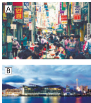
高さ120mの釜山タワー

数百もの商店が並ぶ国際市場(A)、韓国最大級の水産物市場、チャガルチ市場(B)、龍頭山公園(C)など、見どころ満載の地域。龍頭山公園にある釜山タワーには、360度パノラマ展望台があり、釜山の街並みはもちろん、西には影島、南には釜山港なども見ることができます。