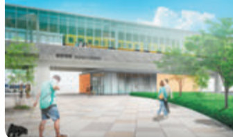
慈眼寺駅交通広場イメージ図