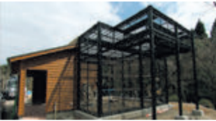
世界のサルゾーン