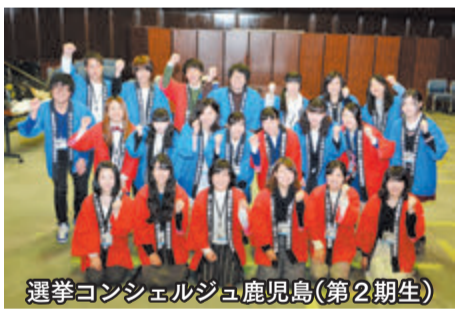
選挙コンシェルジュ鹿児島(第2期生)