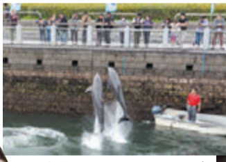
▲青空イルカウォッチング 屋外のイルカ水路では、1日3回イルカのトレーニングの様子が見られます