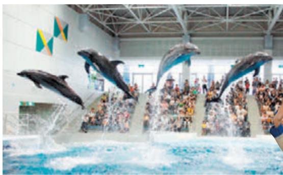
▲イルカプール 1日3回～4回の「いるかの時間」は来館者も参加できて大人気！

イルカやアザラシを間近に見ることができ、どの空間も見どころ満載です。昨年10月に誕生したイルカの赤ちゃんも必見！