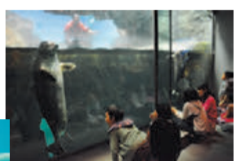
▲アザラシ水槽 ゴマフアザラシのゴマタロウ(オス)とゴマミ(メス)が元気に泳ぎ回ります

▼出会の海空間 地下2階では、水中のイルカに会えます。赤ちゃんイルカのカンナも母親のマールと元気に泳いでいます