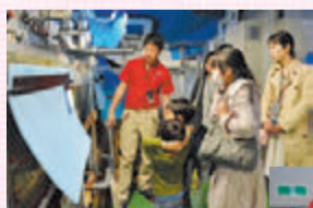
▲バックヤードツアー 普段入ることができない水槽の裏側を探検！(土・日曜日、休日の15時から)

千葉から引っ越してきたばかりで、初めて来ました。大きな水槽で泳ぐジンベエザメはすごかったです。バックヤードツアーにも参加できて、とても楽しかったです♪