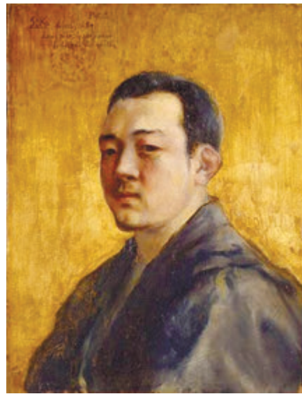
②5 黒田清輝 「自画像」

幕末に薩摩藩士の子として高見馬場で生まれた黒田清輝は、日本洋画の巨匠として知られ、今年生誕150年にあたり、黒田は1884年、18歳でフランスへ渡り、大学で法律を学びました。一方で画家ラファエル・コランの教室で絵画も学んでいましたが、1887年、法律の勉強を放棄して絵画のみを学ぶ決心をしました。