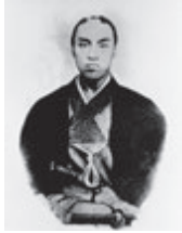
国立国会図書館所蔵