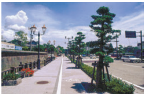
▶西郷銅像や鶴丸城跡などがある国道10号(平成元年7月撮影)

3 昭和62年から5年かけて整備された〇〇〇〇〇〇〇〇〇。ガス灯や石畳など、歴史と文化を感じられる景観の道となっています。