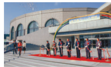
▶開館記念式典の様子

12 平成4年に開館した鹿児島〇〇〇〇。国際規模のスポーツ競技大会が開催できるほか、コンサート会場などにも利用されています。