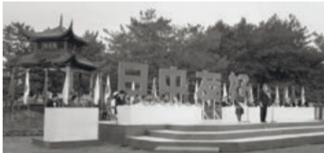
▶友好都市締結を記念して天保山公園に建設された「共月亭」落成式の様子(昭和60年3月)

10 昭和57年、中国の〇〇〇〇市と友好都市になりました。 ヒント：4面をご覧ください。