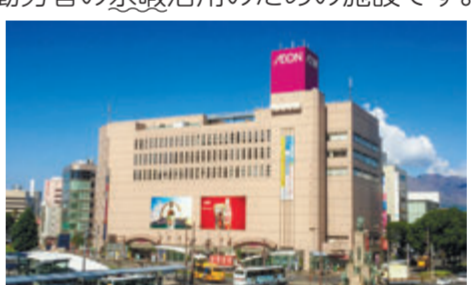
▶鹿児島中央駅前キャンセピル内にあります

13 平成13年に開館した勤労者交流センターの愛称は「〇〇センター」。体育館やトレーニングルームなどを備えた勤労者の余暇活用のための施設です。