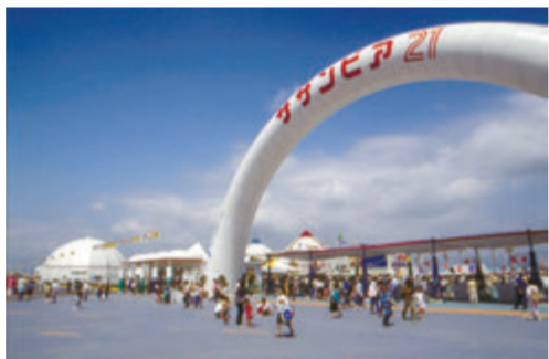
▶多彩なパビリオンやステージイベントなど地方では最大規模の博覧会でした

4 平成元年、市制100周年記念事業として開催された〇〇〇〇〇21。60日間の開催期間中に、延べ88万人が来場しました。