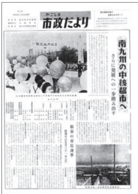
▶第1号の広報紙、第10号から「かごしま市民のひろば」という名前になりました

1 昭和42年4月、南部の〇〇〇〇市と合併。それを機に、広報紙は5月発行分を第1号として新たなスタートを切りました。