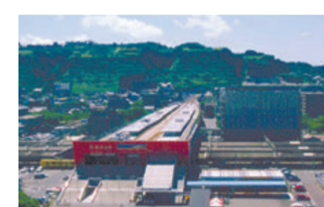
▶駅周辺(平成14年8月撮影)

14 平成16年3月、九州新幹線一部開業に伴い、〇〇〇〇〇〇駅の駅名が「鹿児島中央駅」に変わりました。