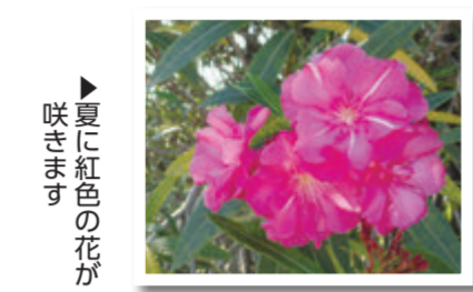
▶夏に紅色の花が咲きます

9 昭和43年、市の木にクスノキ、市の花に〇〇〇〇〇〇〇〇が選ばれました。 ヒント：漢字で書くと夾竹桃です。