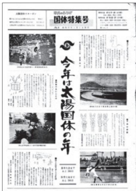
▶昭和47年1月発行市民のひろば国体特集号第3号

2 昭和47年、鹿児島県で第27回国民体育大会「〇〇〇〇国体」が開催され、鹿児島県は男女総合優勝、女子総合優勝の好成績を収めました。