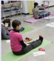
体を整えるエアロビックもやってみました

定期的なスポーツをしたいと思い、昨年、バレーボールとジャズダンスを受講したことがきっかけで、ここに通うようになりました。同じ趣味の人も多いので友達もできるし、交流の幅が広がりました。スポーツのほかにも語学や料理などもあるので、選ぶ楽しさもあります。運動会やキャンプなどのイベントもあるんですよ! 次の前期講座の申込受付は4月から。何を受けるかすでにワクワクしています♪