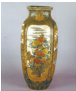
19世紀後半(明治時代前期)に作られた薩摩金襴手大花瓶 (市立美術館蔵)

薩摩藩を含め日本からの出品品は珍しがられ、瞬く間に人気となったことから、いわゆるジャポニズム(日本趣味)の契機となりました。