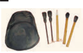
西郷愛用の硯・筆