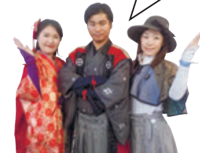
薩摩こんしえるじゅ。とまちなかおもてなし隊

篤姫や西郷どん(まちなかおもてなし隊)と「かごでん」乗車&まち歩きで笑いあふれる体験を!