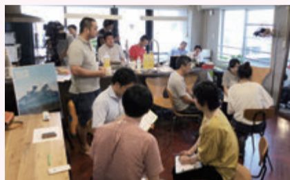
ワークショップの様子

それを基に、みんなが盛り上げるために使うブランドメッセージとロゴマークの案を作りました。今回作成した3つの案の中から、皆さんの投票で決定します。