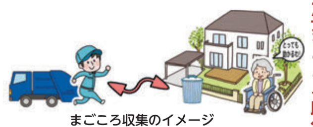
まごころ収集のイメージ