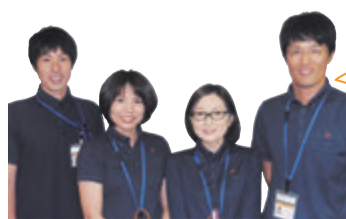
生活支援コーディネーターの皆さん

内支援が必要な高齢者の生活援助を地域で行うボランティア活動(支えあい活動)に必要な知識や取り組み事例などを学ぶ研修会 対支えあい活動をしている団体・個人(予定を含む) ※活動を行う団体には、年間50万円を上限に助成あり 期12月17日(火)9時30分～14時30分 所鹿児島アリーナ 定50人程度 申電話かはがき、ファクス、メールで住所、氏名、年齢、電話番号を12月3日(消印有効)までに〒890-0072新栄町1-11長寿あんしん相談センター本部☎813-1040FAX813-1041E-mail:seikatsu@kg-shien.orgへ ※市HPからも可