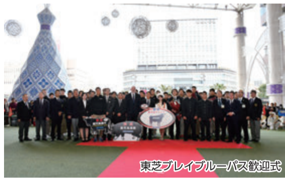
東芝ブレイブルーパス歓迎式