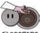
ごみや木の根を除去

◇風呂場や台所の外に設けてある汚水ます(特にトラップますの底にある目皿)に付着したごみや侵入した木の根は、詰まりの原因となりますので、定期的に取り除いてください 問 水道局給排水設備課☎213-8522 FAX 259-1627