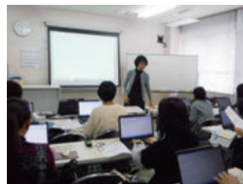
初めてのパソコンW&E