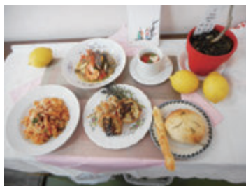
おもてなしのイタリアン

申 直接(返信用はがきが必要)か往復はがき(1人1枚。第2希望まで)で1月15日(必着)までに〒890-0063鴨池二丁目31-15勤労女性センター☎・FAX255-7039へ ※日曜日、祝日は休館