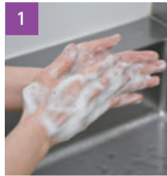
泡立てたせっけんで、手のひらをよく洗う