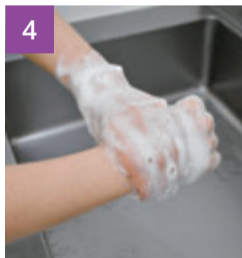
親指の付け根や指先、手首もしっかり洗う