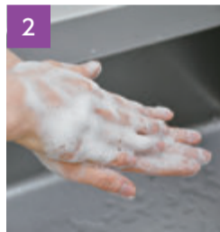
両手の甲もしっかり洗う