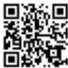
夢すくすく ねっと

◇メール相談(夢すくすくねっと)は二次元コード から相談フォームをご利用ください