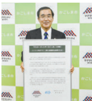
森市長による宣言

本市は、市民の皆さんや事業者と一体になって温暖化対策に取り組むため、九州の市として初めて宣言しました。